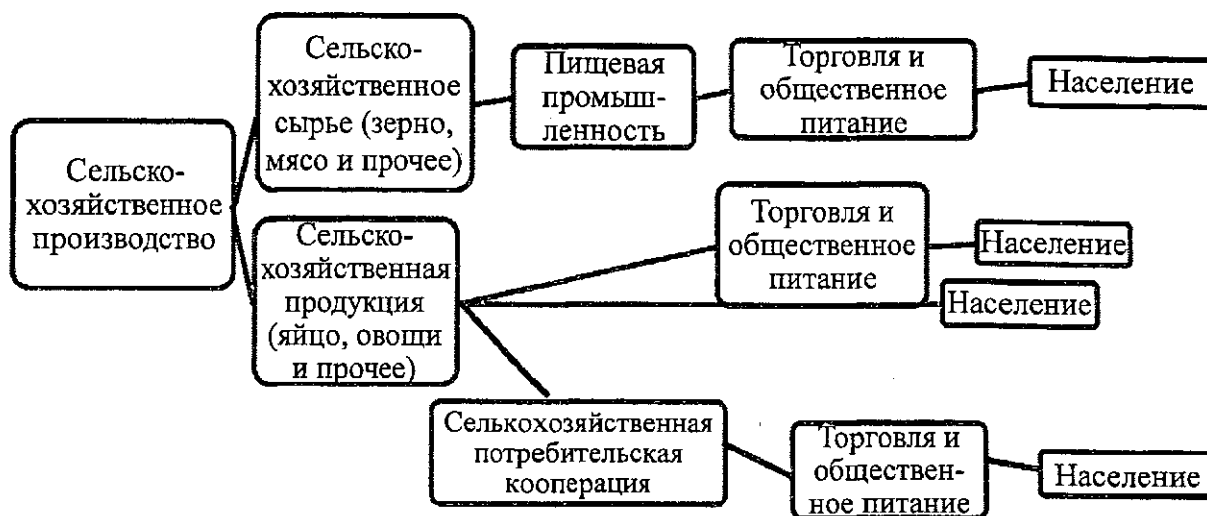
Рис. 1. Схема реализации продукции участников агропромышленного кластера

реализации продукции участников агропромышленного кластера представлена на рисунке 1.